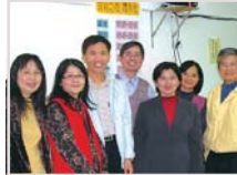
←左：吉慶主臨畫展開幕 中：司琴法上課情形 右：基宣楊梅評估會