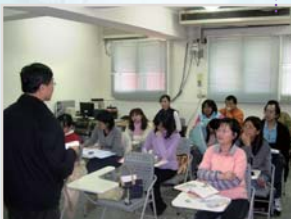
↑ 同步遠距教室一隅