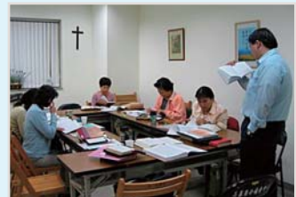
↑ 嘉南分部學員上課情形