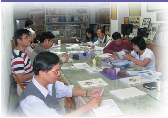
↑ 招生籌備會齊聚眾人創意