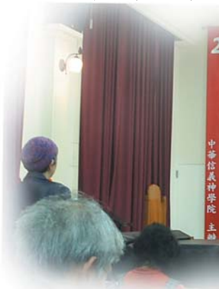
↑ → 「成聖觀研討會」與會者提問踴躍

2. 本學期由歐使華牧師開授碩士班，十週的密集課程：羅馬書和約翰福音，已於 11/9 結束，學生受益匪淺；歐牧師於 11/11 回美國；普愛民牧師 11/13 ~ 12/19 教授神碩二年級在職生『路德神學研討 IIa』課程，普牧師 12/19 課程結束，12/20 回德國。