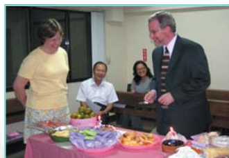
← 歡送歐牧師、師母 ↓ 歐牧師與密集班的學員合影