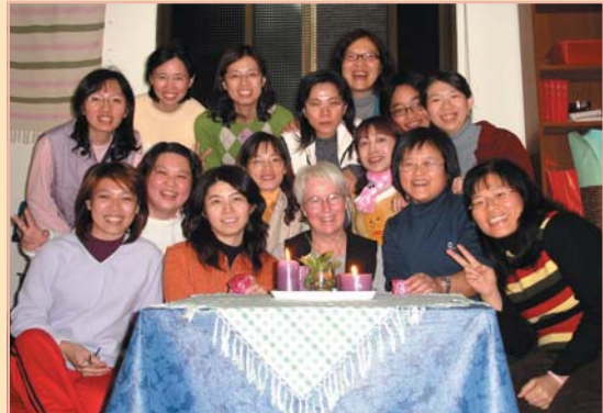
↑ 藉著宿舍會議深入了解關心學生的需要

可以是充滿喜樂，每天對人、對自己都要有一點驚喜、好玩的事。服事是不枯竭我們自己，而是要越服事越喜樂，因為神與我們同在，祂喜悅我們藉由祂的創造物，多多的認識祂，思想到祂的恩典，祂把一切都造得如此美好，我們要懂得珍惜和活用這些真理。當初回應信神的邀請，希望我再回來的時候，我真覺得自己不配；但神讓我看到神學院的教育是重要的，所以我很願意把我的時間，放在關心學生們的需要上。其實從他們的身上，我看到他們願意服事主的那種堅定，真的很欽佩他們，而且我可以得到他們的信任，我得到了更多的喜樂。耶穌是一位有活潑生命的老師，祂來到世上，給世人帶來喜樂跟希望；服事主事雖是件嚴肅的事，但我每天還是願意找一盆小小的花，佈置一下，找一些好玩的事跟同學們分享，這對我來說也是很重要的事情之一。