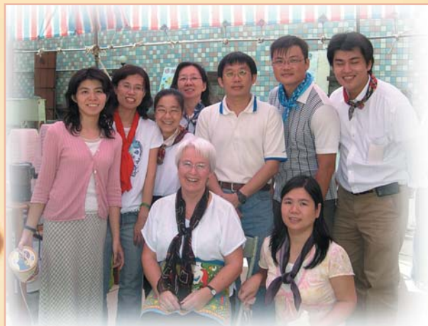
←↑ 宋教士（前排中）和學生小組一起熱力參與校慶園遊會