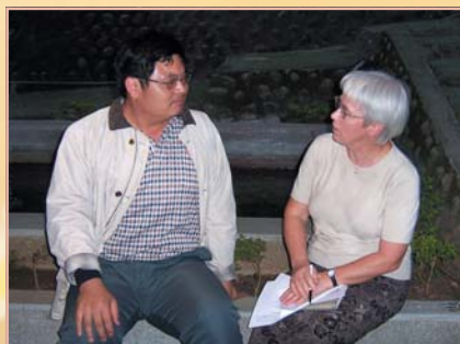
← 宋教士和學生幾乎無話不談

我們的學生真的很忙，讀書也是跟人有關，因為他們以後的工作是要餵養神的羊，幫助信徒在靈性上的建造；自己除了對學校的責任、活動參與，還要在實習的教會服事，有時候真的很忙、很累。所以我鼓勵他們，要知道什麼是最重要的？自己跟神可以有單獨約會的時間是很重要的，因為神是他們最大的力量，最大的喜樂；還有讓他們記得為什麼神帶領他們來在這裡？同學們有他們的煩惱，我可以借給他們兩個耳朵，在我辦公室的小角落為他們禱告，也為他們的家人禱告。我和學生什麼事都可以談，只要他們有需要，不管幾分鐘或幾個小時都可以聊聊，一起為他們的生活、家人、感情、服事禱告，我可以陪伴他們；關係的建立是很重要的，人和事情對我來說，人更重要，這是在這裡服事的原則。