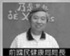
前國民健康局局長