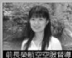
前長榮航空空服員